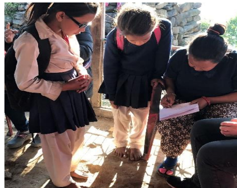
Bespreken van nieuwe aanvragen

Ook kijken we samen naar de nieuwe aanvragen. De voorselectie is reeds door de Nepalese bestuursleden gedaan.