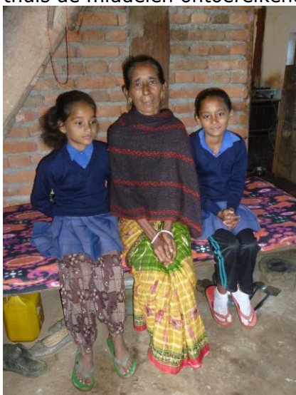
2-ling Jamuna en Ganga Pandit met moeder. Zij ontvangen ook hun lunch op school.

Zijn er problemen dan brengen zij een thuisbezoek aan ouder en kind. SDEF voorziet ook enkele kinderen van tandpasta en zeep. Daarnaast is er ook een aantal kinderen die ontbijt en lunch van ons op school ontvangen omdat thuis de middelen ontoereikend zijn.