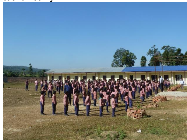
Ochtendgymnastiek Gorackchyanath Sec School in Makwanpur

We zien dat de studenten heel erg gemotiveerd zijn en serieus met hun toekomst bezig zijn. Mede door het werk van onze bestuursleden die ontzettend veel werk verzetten in het begeleiden en ondersteuning bieden in het maken van keuzes in het schooltraject, zien we dat kinderen blij en enthousiast over de toekomst zijn.