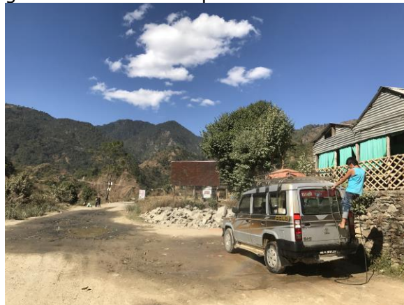
Op weg naar Hetauda

Het is iedere keer ontzettend fijn om iedereen in Nepal weer te zien. Aan de kinderen zie je hoe snel de jaren gaan. We hebben in 10 dagen ontzettend veel gedaan, veel gereisd, veel gelopen, veel gelachen en veel besproken.