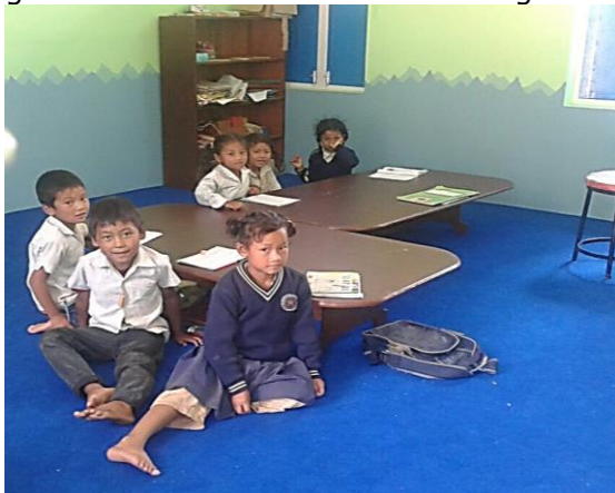
Govermental school in Sindupalchok

In Kathmandu gaan de kinderen veelal naar non-govermental scholen. Op het platteland is dit niet altijd mogelijk omdat deze er niet zijn of de reistijd te ver is. Non-govermental scholen staan beter aangeschreven, maar het niveau op de govermental scholen is zeker ook goed.