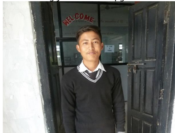
Bibek Parajuli Makawanpur Multiple Campus

In 2018 zijn er 11 studenten die in het bezit van SLC zijn en door kunnen stromen naar higher secondary onderwijs. Dit niveau is vergelijkbaar met dat van het havo-diploma. De kosten hiervoor zijn circa 400 euro. Deze kosten betalen wij uit het Scholarship dat we vorig jaar hebben opgericht.