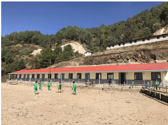
Nieuw schoolgebouw Nigale Higher Secondary School

Door het jaar zorgen onze bestuursleden in Nepal dat de aanwezigheid en voortgang op school goed gemonitord wordt. Dit wordt per mail met ons gecommuniceerd.