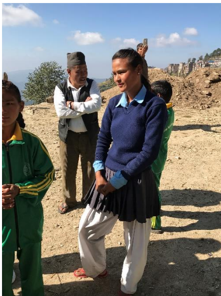
Urmila Tamang Nigale Higher Secondary School

Urmila is 16 jaar en loopt elke ochtend 45 minuten om bij haar school te komen. Voor het volgen van klas 11-12, in een andere plaats, zal ze gezien de reistijd op kamers moeten verblijven. Studenten hebben vanaf deze leeftijd dan vaak al een klein baantje zodat ze zelf ook een klein deel in de kosten kunnen bijdragen.