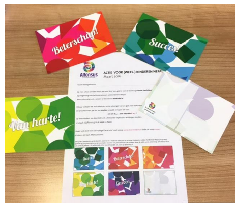
Setjes ansichtkaarten die volop zijn verkocht!

Aan alle jongens en meisjes van de basisschool in Enschede: Heel erg veel DANK! Super!