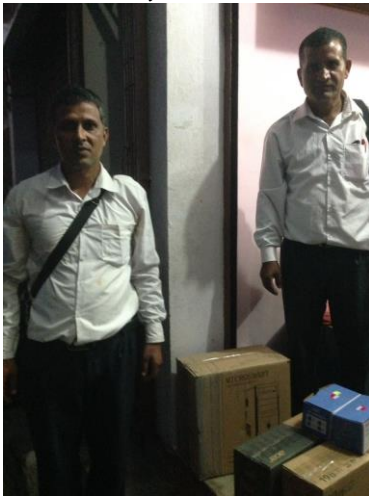
De leerkrachten met de computers nog in dozen.

met z'n allen een film gekeken worden (als er elektriciteit is.....)