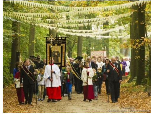
Een groot aantal bezoekers nam deel aan de tocht.

Ieder jaar wordt er een pelgrimstocht vanuit de H. Gerardus Majella kerk in Overdinkel gelopen. Op zondag 16 oktober 2016 vond voor de 104e keer de Heilige Gerardus Majella bevaart plaats.