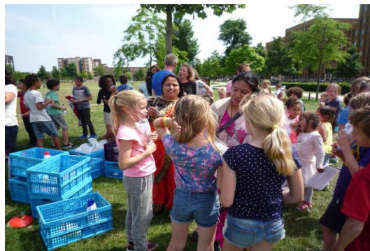
De kinderen vonden het erg leuk om met onze Nepalese bestuursleden te praten.

via mail, chat of skype met elkaar communiceren.