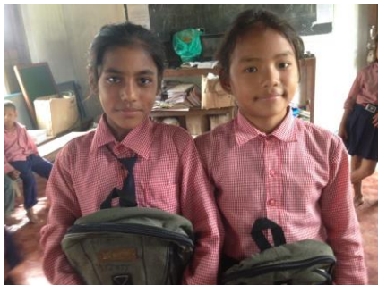
Nieuwe schooltassen voor de studenten.

In het totaal zijn er 75 kinderen die het basisonderwijs programma volgen.