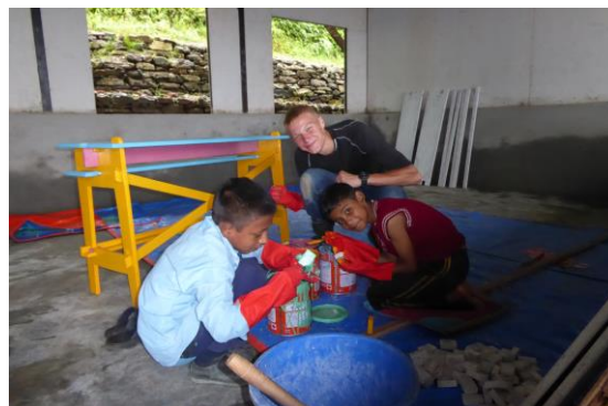
Student van de meubelvak school aan het werk met lokale jongeren.

In de zomer van 2016 zijn 2 groepen met in totaal 18 vrijwilligers met volle inzet aan de slag gegaan in het afgelegen gebied in het Noorden van Nepal.