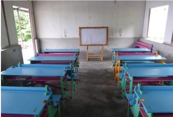
Heel hard gewerkt: fantastisch resultaat!

was het mogelijk om het bankje aan te passen voor de jongere kinderen. In totaal zijn er 60 prachtige en kleurrijke bankjes voor de scholen in Nepal gemaakt. Daarnaast is er voor nog eens 60 bankjes, aan hout achtergelaten samen met het ontwerp!